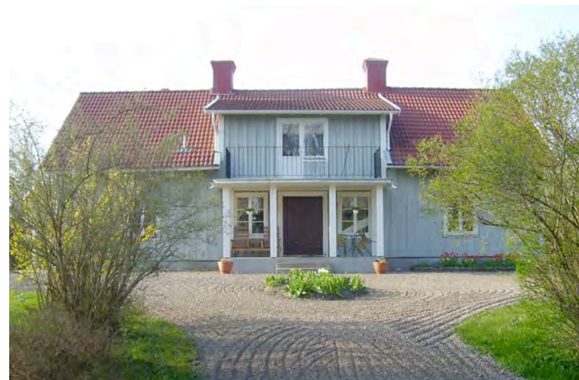
Änkegården i Rappestad, se artikel på mittuppslaget.