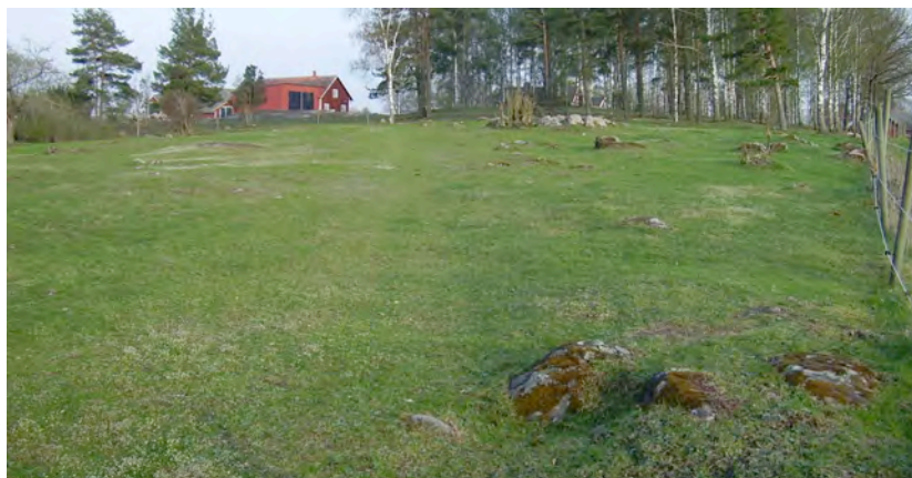
Rappestads äldsta delar med Storgården i bakgrunden och Arnorpsvägen till höger i bilden.

Den markerade bybacken vid Rappestad förefaller att ha varit bebyggd redan under stenåldern. Ett flertal fynd av stenxor av olika typer hittade på den gamla bytomten förvaras i Östergötlands länsmuseums magasin. Ytterligare yxor och ett guldmynt hittade i samma område förvaras på Statens historiska museer och finns redovisade i en utredningsrapport från UV-Linköping (Skjöldebrand 1995)."