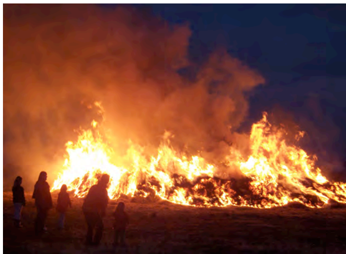
Den sista april är det majbål och fyrverkerier i Rappestad.