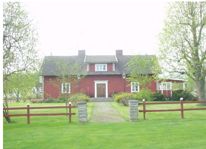
Storgården i Rappestad, se artikel på mittuppslaget.