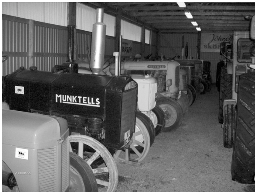
En lång rad med gamla traktorer i Bo Strålhakes traktormuseum.