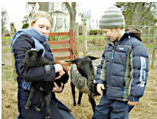
Lamm på Fågelberg, flitigt besökta av Rappestads yngre invånare.