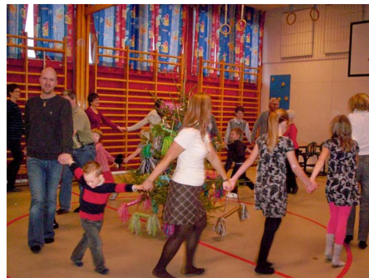
Julgransplundring i Rappestad, den 13 januari 2008.