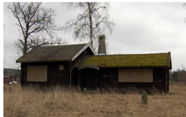
Birka i Rappestad, våren 2008.