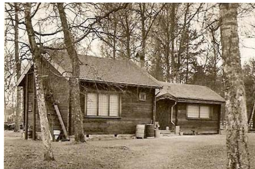
Birka i Rappestad (äldre bild), se artikel på mittuppslaget.