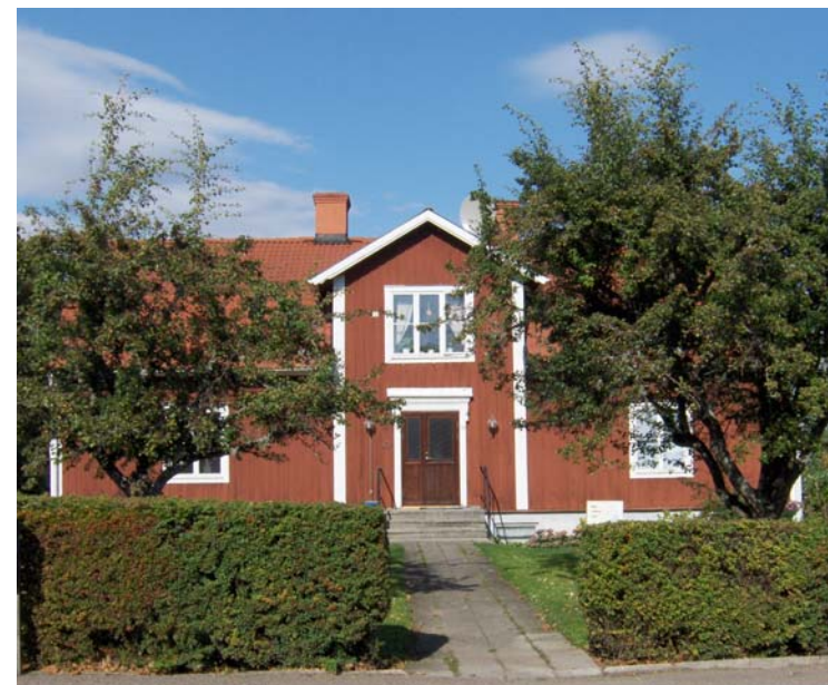
Klockargård i Rappestad, se artikel på sidan 3.