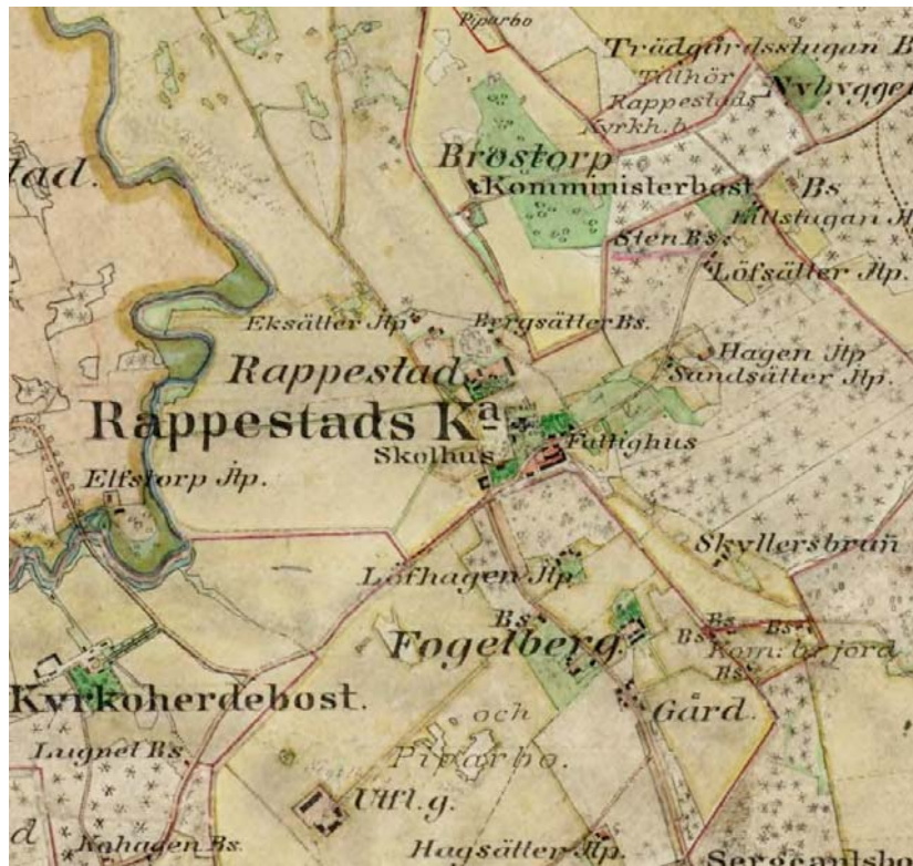
Rapestad 1868-77. Jtp betyder jordtorp. Till dessa fanns någon åker och kanske äng. Bs betyder backstuga. Här fanns i bästa fall en kålgård eller täppa. Utfl.g. innebar att gården flyttats hit efter skiftet.

Vi har i detta och tidigare nummer berättat om olika platser och gårdar. På detta uppslag kan ni lokalisera de olika platserna. Hela kartmaterialet finns på Häradsekonomisk karta, på DVD.