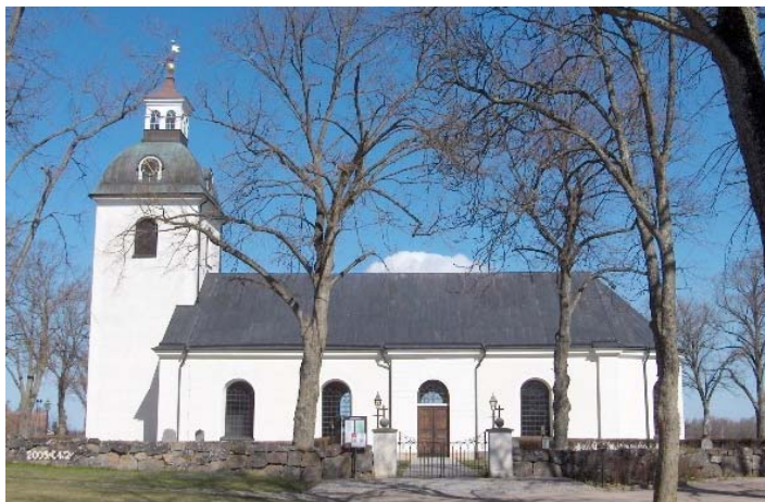
Rappestads kyrka 1807 - 2007 år.