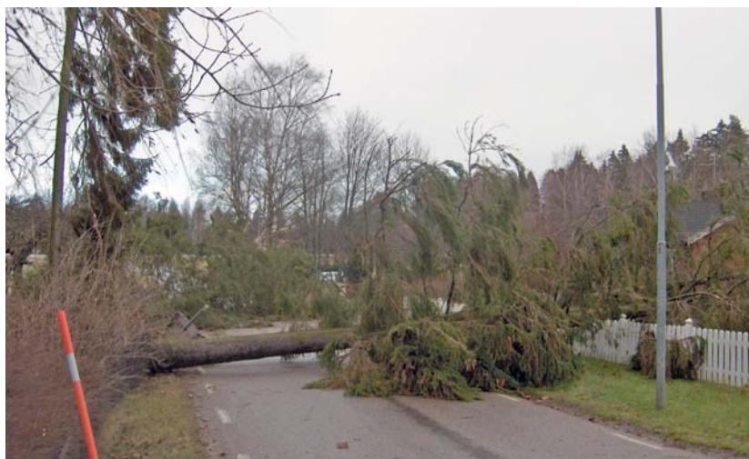
Stormen Per gick hårt fram i Rappestad den 14 januari.