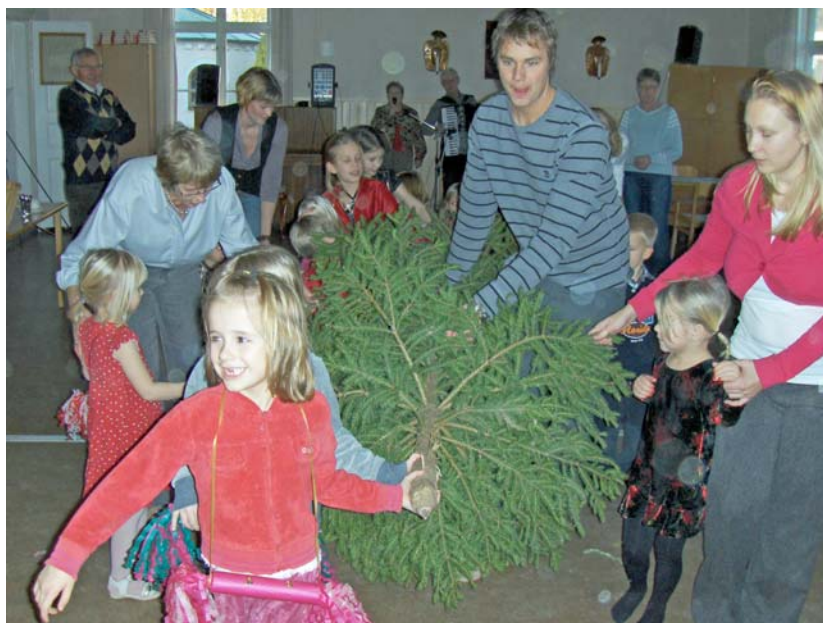
Julgransplundringen var uppskattad av både barn och vuxna.