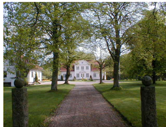
Fågelberg gård utanför Rappestad, se artikel på sidan 3.