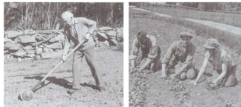
Morötter såddes med en handsåmaskin för att senare gallras för hand.