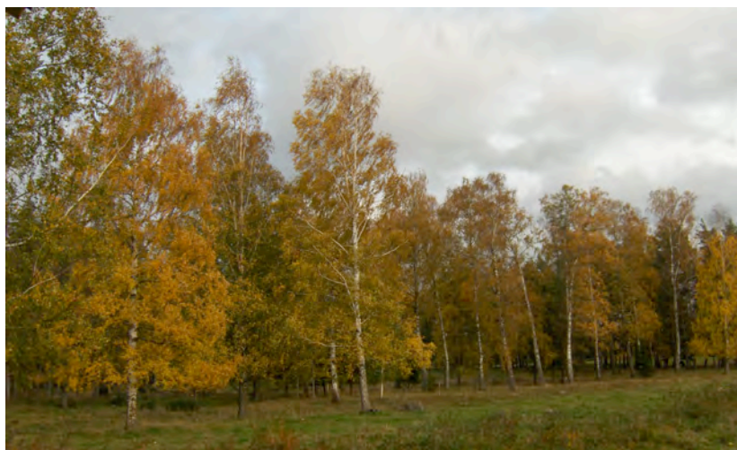
Höst i Rappestad.