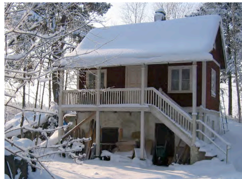
Lyckan i Rappestad, se artikel på mittuppslaget.