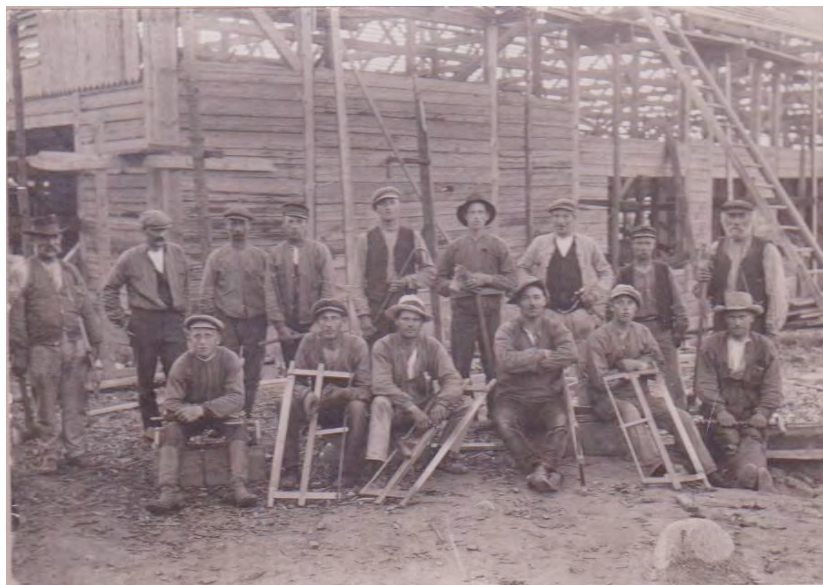
Ladugården vid Berg under byggnad.