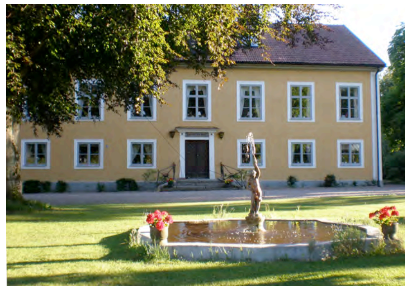
Mangårdsbyggnaden på Ekströmmen, se artikel på mittuppslaget.