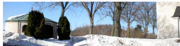
Gravkapellet med tornet på Rappestad kyrka till höger.