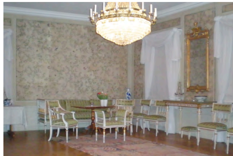
Salong på Ekströmmen med kinesiska ris-tapeter från 1700-talet, importerade av Ostindiska kompaniet.