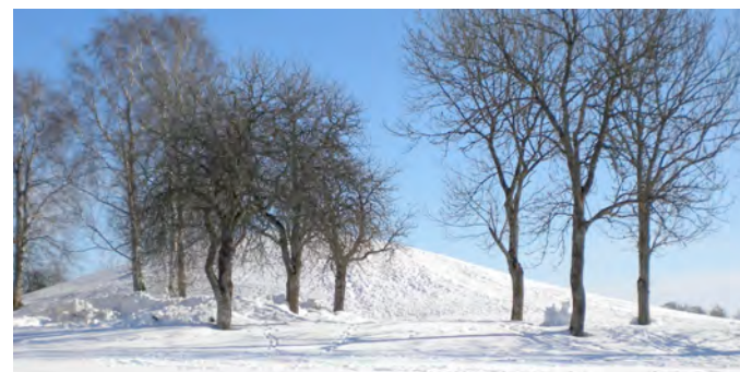
Ledbergs kulle i vinterskrud.

Ett hedniskt dån från dova lurar höres och nuets ögonblick är återställt: - av gräs är Ledbergs kulle åter täckt.