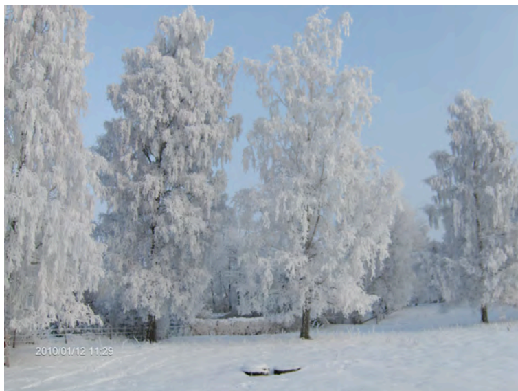
Bosses hage, knappt sex månader före 6 juni.