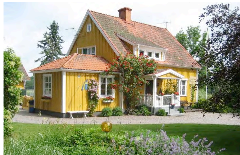
Furulid i Rappestad, se artikel på mittuppslaget.