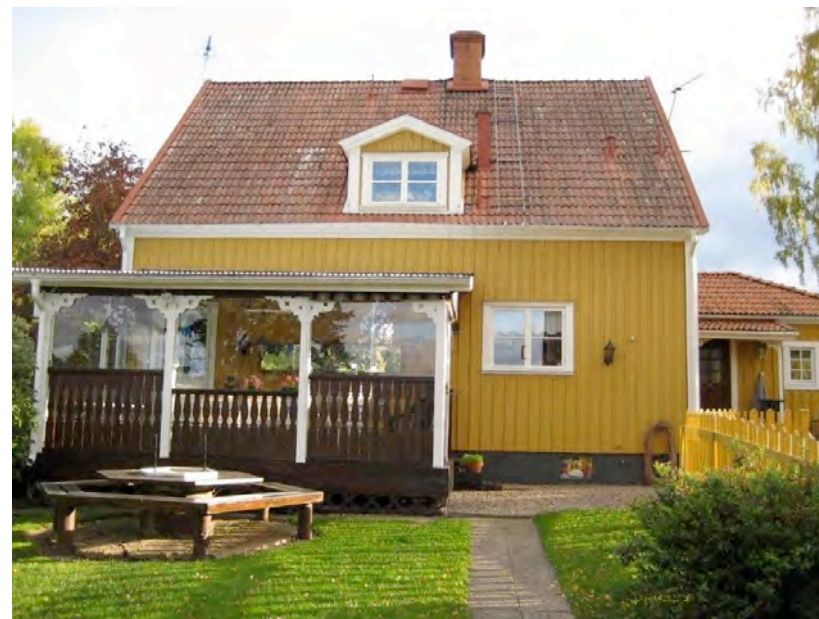
Furulid, sett från baksidan.