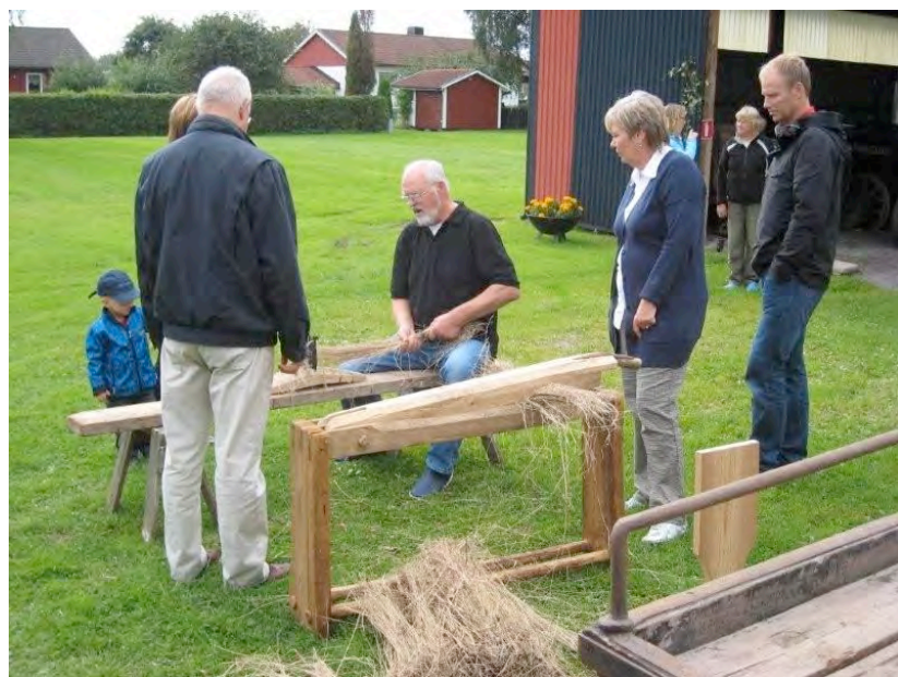
Demonstration av linberedning under Östgötadagarna.